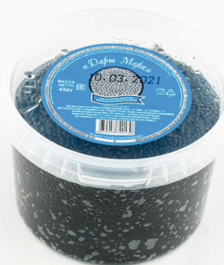
ИКРА ЧЕРНАЯ «ДАРЫ МОРЯ»