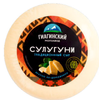
СЫР СУЛУГУНИ 200г 1/8 шт