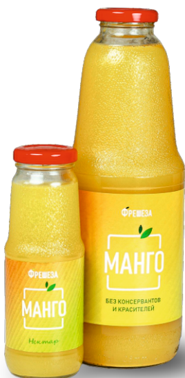
Нектар «Фрешеза» ~ Манго ~ 250 мл | 1000 мл