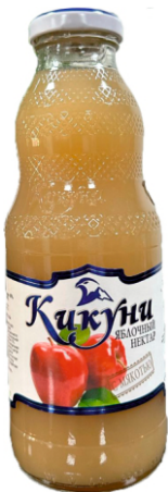
Нектар "Кикунь" Яблочный с мякотью 0,5 л | 12 шт/уп