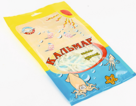
КАЛЬМАР СУШЕНЫЙ 35г 1/50 шт