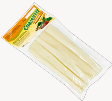
СЫР КАРАНДАШ БЕЛЫЙ