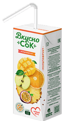
Напиток «Вкусносок» ~ Мультифрукт ~ 0.2 л 1/27 шт