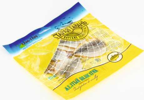
ЖЁЛТЫЙ ПОЛОСАТИК «СТАРАЯ ГАВАНЬ» 30г 1/80 шт