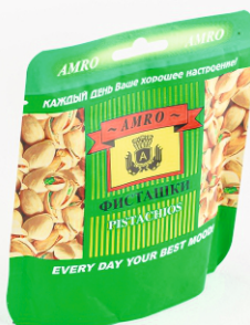
ФИСТАШКИ АМРО ОРИГИНАЛ 70г 1/28 шт