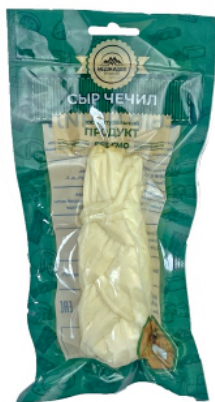
СЫР «ЧЕЧИЛ» «КОСИЧКА» БЕЛЫЙ 100г 1/10 шт