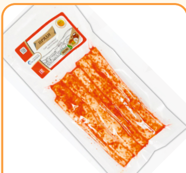
СЫР КАРАНДАШ С ПЕРЦЕМ «ПРЯДИ» 100г 1/10 шт