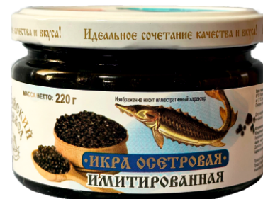
ИКРА ЛОСОСЕВАЯ КРАСНАЯ ИМИТ-Я «КАСПИЙСКИЙ НЕВОД» 220г 1/36 шт