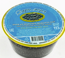
ИКРА ЧЕРНАЯ «ДАРЫ МОРЯ»