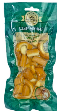
СЫР «ЧЕЧИЛ» «КУСОЧКИ» КОПЧЕНЫЙ 100г 1/10 шт