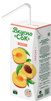
Напиток «Вкусносок» ~ Персик ~ 0.2 л 1/27 шт