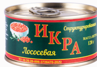
ИКРА ЛОСОСЕВАЯ СТРУКТУРИРОВАННАЯ