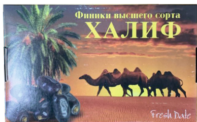
Финики «ХАЛИФ» 1/12 шт