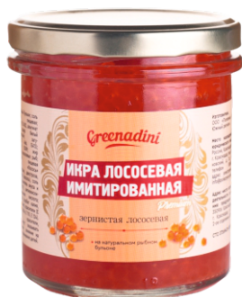
ИКРА ЛОСОСЕВАЯ ИМИТИРОВАННАЯ КРАСНАЯ СТ/Б 300г 1/6 шт