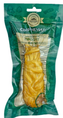
СЫР «ЧЕЧИЛ» «КОСИЧКА» КОПЧЕНЫЙ 100г 1/10 шт