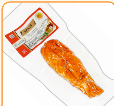
СЫР КОСА КОПЧЕНАЯ «ПРЯДИ» 100г 1/10 шт