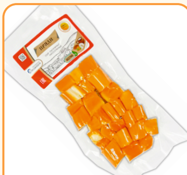
СЫР ОХОТНИЧИЙ КУСОЧКИ «ПРЯДИ» 100г 1/10 шт