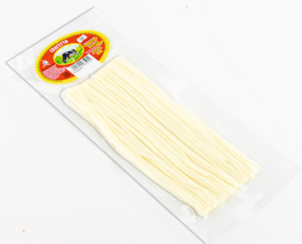
СЫР ЛАПША 30г 1/50 шт