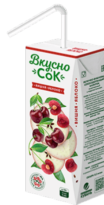
Напиток «Вкусносок» ~ Вишня ~ 0.2 л 1/27 шт