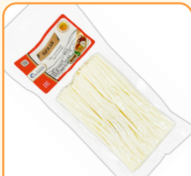
СЫР ЛАПША «ПРЯДИ» 100г 1/10 шт