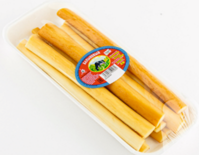
СЫР ОХОТНИЧИЙ в лотке 180 г