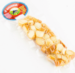
СЫР КОПЕЙКА 80г 1/20 шт