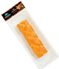
СЫР КОСА «ГИАГИНСКИЙ» 100г 1/10 шт