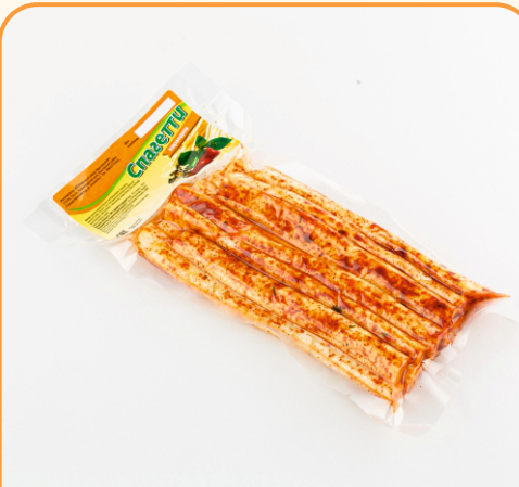
СЫР КАРАНДАШ С ПЕРЦЕМ ЧИЛИ 100г 1/10 шт