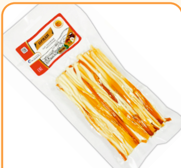
СЫР ЛАПША КОПЧЕНАЯ «ПРЯДИ» 100г 1/10 шт