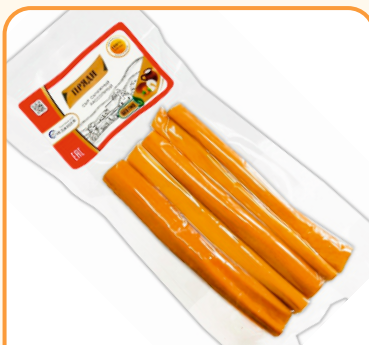
СЫР ОХОТНИЧИЙ «ПРЯДИ» 100г 1/10 шт