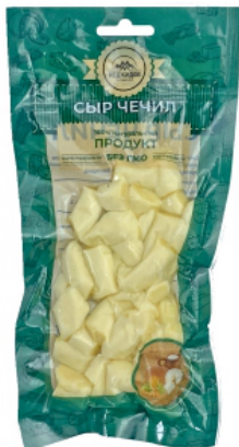
СЫР «ЧЕЧИЛ» «КУСОЧКИ» БЕЛЫЙ 100г 1/10 шт