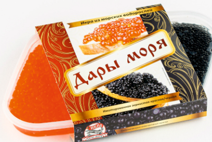
ИКРА АССОРТИ «ДАРЫ МОРЯ»