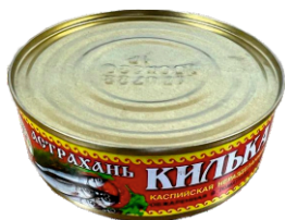
КИЛЬКА КАСПИЙСКАЯ В ТОМАТНОМ СОУСЕ 250 г, без ключа, 1/48 шт