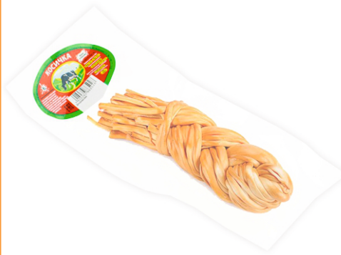
СЫР КОСА КОПЧЕНАЯ В ВАКУУМЕ ШТУЧНО, БЕЗ ВОЗВРАТА!