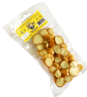
СЫР ПЯТЕРКА 100г 1/50 шт