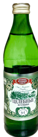
Вода Минеральная «Нагутская Целебная №4» стекло 0,45 л