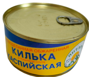
КИЛЬКА КАСПИЙСКАЯ В ТОМАТНОМ СОУСЕ 350 г, с ключом, 1/36 шт