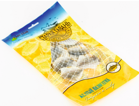
ЖЁЛТЫЙ ПОЛОСАТИК «СТАРАЯ ГАВАНЬ» 60г 1/50 шт