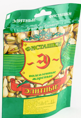
ФИСТАШКИ ЭЛИТНЫЕ 60г 1/20/100 шт