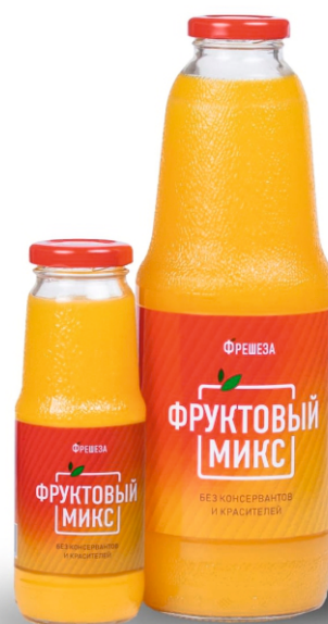
Нектар «Фрешеза» ~ Фруктовый микс ~ 250 мл | 1000 мл