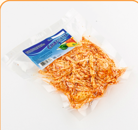
СЫР СТРУЖКА С ПЕРЦЕМ ЧИЛИ 100г 1/10 шт