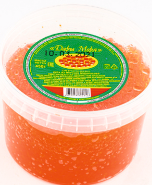
ИКРА КРАСНАЯ «ДАРЫ МОРЯ»