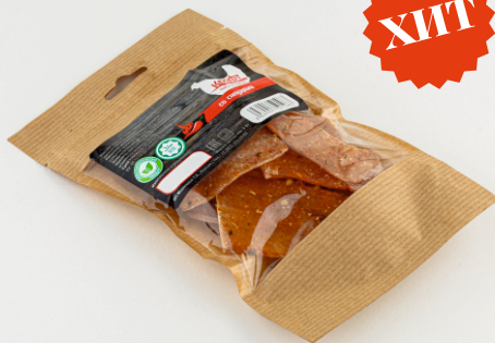
ЧИПСЫ ИЗ КУРИЦЫ «КРАФТ» 40г 1/10 шт