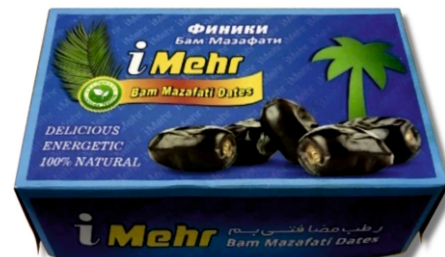
Финики iMehr Бам Мазафати 1/12 шт/уп