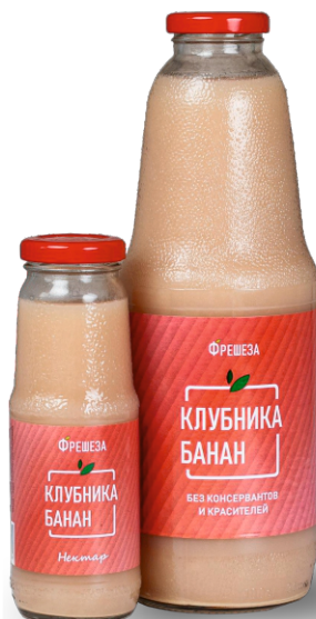
Нектар «Фрешеза» ~ Клубника Банан ~ 250 мл | 1000 мл