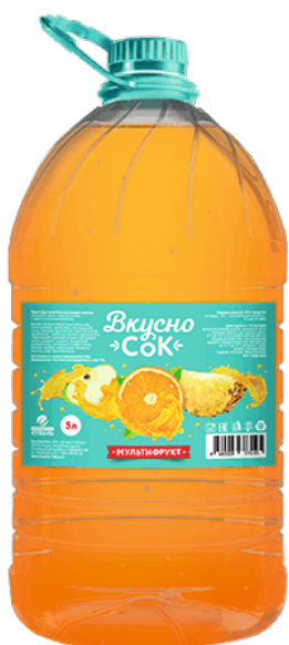
Напиток «Вкусносок» ~ Мультифрукт ~ ПЭТ 5 л 1/2 шт