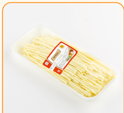
СЫР ЛАПША «ПРЯДИ» В ЛОТКЕ 170г