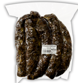
КОЛБАСА СУШЕНАЯ В ВАКУУМЕ 0.5 кг / 1 кг