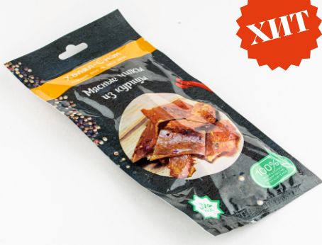
ЧИПСЫ ИЗ КУРИЦЫ «ХАЛЯЛ-СНЭК» 40г 1/10 шт