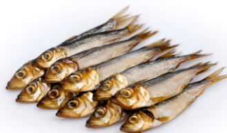
САЛАКА КОПЧЕНАЯ ВЕСОВАЯ кг