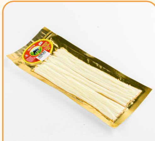
СЫР ЛАПША ЗОЛОТО 40 г 1/50 шт