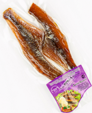
ТУШКА ВОБЛЫ ЧИЩЕНАЯ