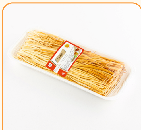
СЫР ЛАПША КОПЧЕНАЯ «ПРЯДИ» В ЛОТКЕ 170г