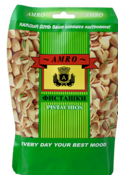
ФИСТАШКИ АМРО ОРИГИНАЛ 175г 1/28 шт