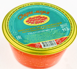
ИКРА КРАСНАЯ «ДАРЫ МОРЯ»