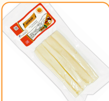
СЫР КАРАНДАШ «ПРЯДИ» 100г 1/10 шт