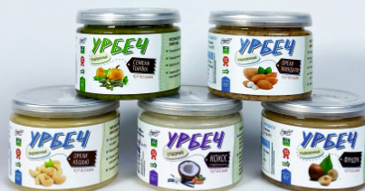
Урбеч Ассорти 1/5 шт/уп