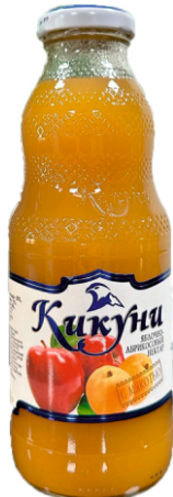
Нектар "Кикунь" Яблоко-абрикос с мякотью 0,5 л | 12 шт/уп