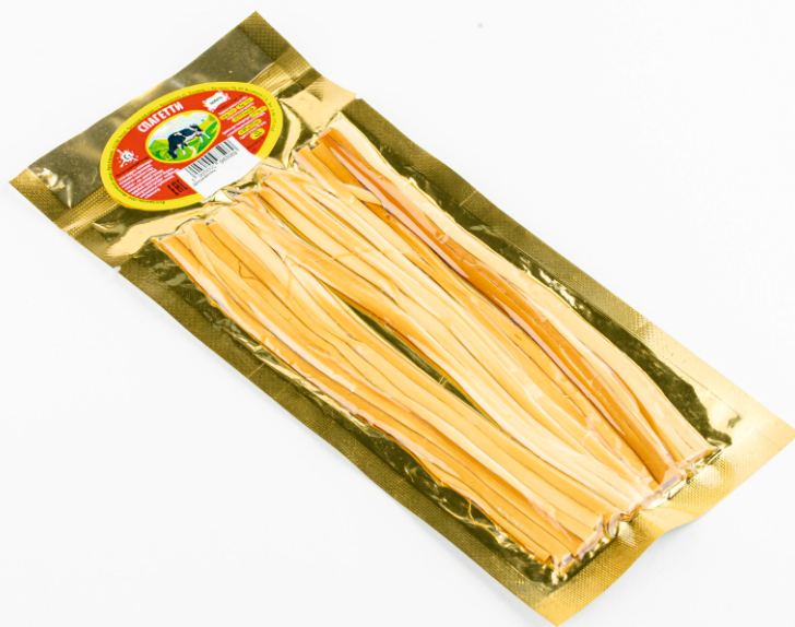
СЫР ЛАПША ЗОЛОТО КОПЧЕНЫЙ