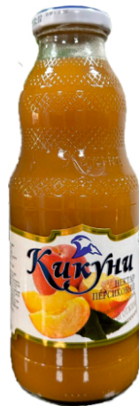
Нектар "Кикунь" Персиковый с мякотью 0,5 л | 12 шт/уп