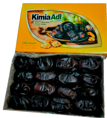
Финики Kimia Adl Бам Мазафати 1/12 шт/уп