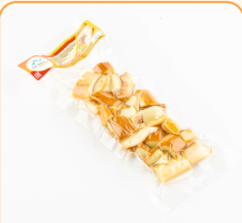
СЫР ОХОТНИЧИЙ КУСОЧКИ 80г 1/20 шт