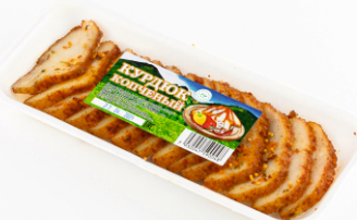
КУРДЮК КОПЧЕНЫЙ в лотке 100 г