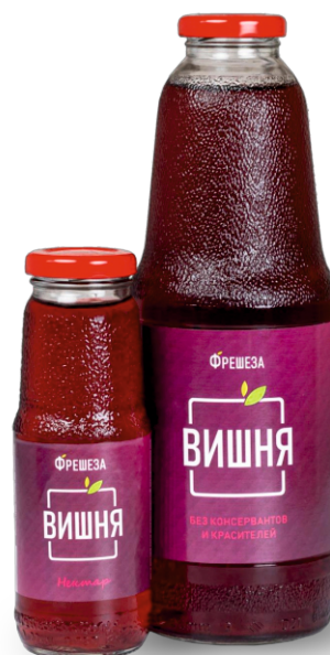
Нектар «Фрешеза» ~ Вишня ~ 250 мл | 1000 мл