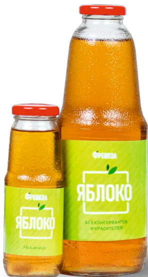
Нектар «Фрешеза» ~ Яблоко ~ 250 мл | 1000 мл