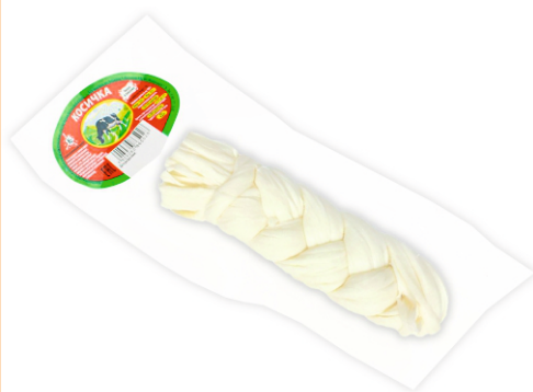
СЫР КОСА БЕЛАЯ В ВАКУУМЕ ШТУЧНО, БЕЗ ВОЗВРАТА!