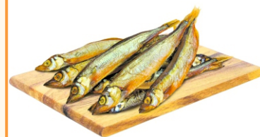
МОЙВА КОПЧЕНАЯ ВЕСОВАЯ кг