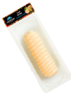
СЫР ЧЕЧИЛ «ГИАГИНСКИЙ» 100г 1/10 шт