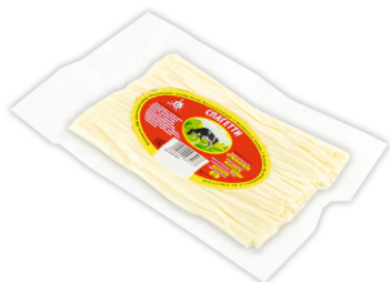
СЫР ЛАПША 50г 1/50 шт