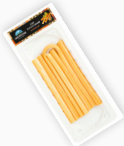
СЫР ОХОТНИЧИЙ «ГИАГИНСКИЙ» 100г 1/10 шт