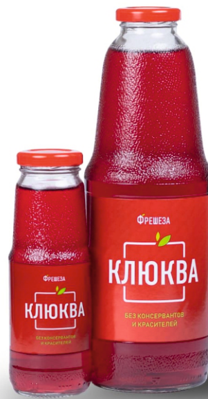
Нектар «Фрешеза» ~ Клюква ~ 250 мл | 1000 мл