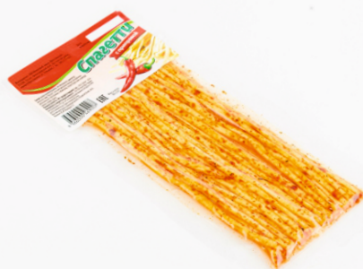
СЫР ЛАПША С ПРИПРАВой ЧИЛИ 30г 1/30 шт