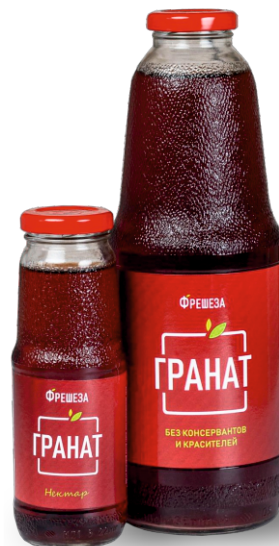
Нектар «Фрешеза» ~ Гранат ~ 250 мл | 1000 мл