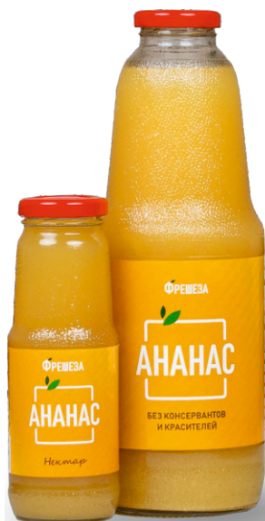
Нектар «Фрешеза» ~ Ананас ~ 250 мл | 1000 мл