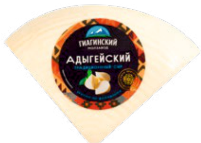
СЫР АДЫГЕЙСКИЙ ТРАДИЦИОННЫЙ 300г 1/6 шт