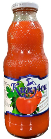
Сок "Кикунь" Томатный 0,5 л | 12 шт/уп