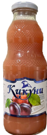
Нектар "Кикунь" Аблоко-слива с мякотью 0,5 л | 12 шт/уп