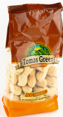
АРАХИС В СКОРУПЕ 160г 1/12 шт