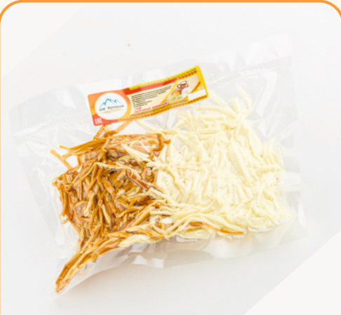
СЫР СТРУЖКА АССОРТИ 150г 1/10 шт