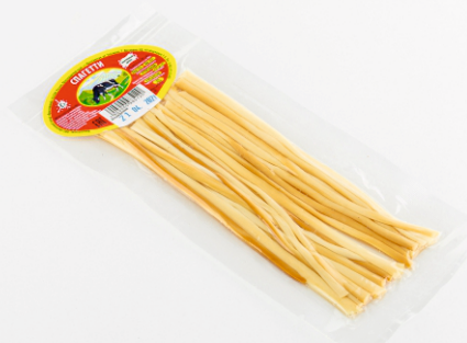
СЫР ЛАПША КОПЧЕНАЯ 30г 1/50 шт