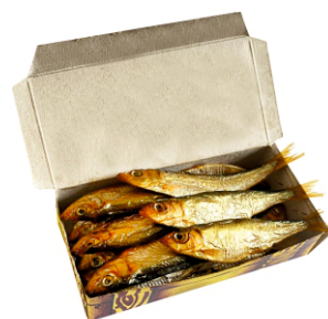
КИЛЬКА КОПЧЕНАЯ 100г 1/50/120 шт