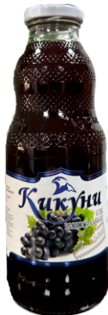
Сок "Кикунь" Виноградный 0,5 л | 12 шт/уп