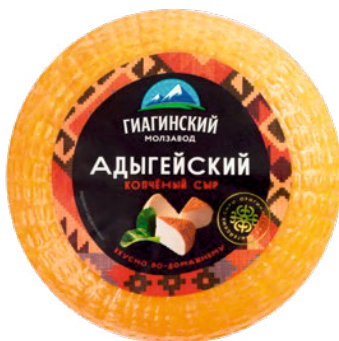
СЫР АДЫГЕЙСКИЙ КОПЧЕНЫЙ 250г 1/12 шт