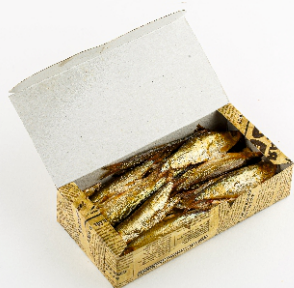
КИЛЬКА КОПЧЕНАЯ 250 г