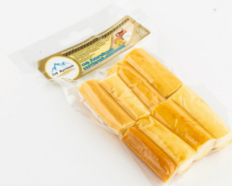
СЫР ГИГАНТ ОХОТНИЧИЙ 100г 1/20 шт