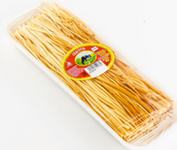
СЫР ЛАПША КОПЧЕНАЯ в лотке 150 г