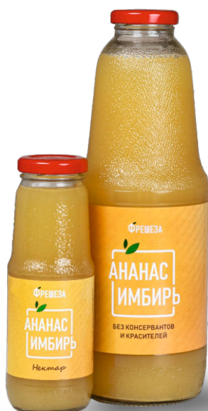
Нектар «Фрешеза» ~ Ананас Имбирь ~ 250 мл | 1000 мл