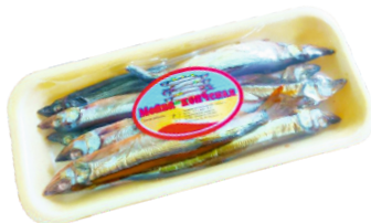
МОЙВА КОПЧЕНАЯ В ЛОТКЕ 180г