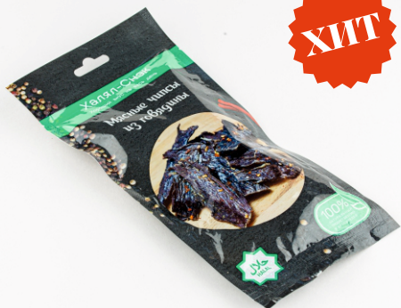
ЧИПСЫ ИЗ ГОВЯДИНЫ «ХАЛЯЛ-СНЭК» 40г 1/10 шт