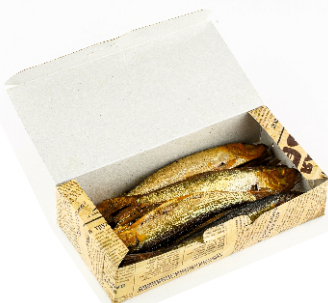
САЛАКА КОПЧЕНАЯ 250г