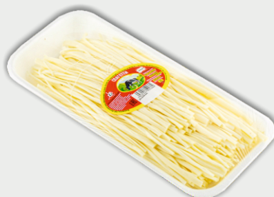
СЫР ЛАПША в лотке 180 г