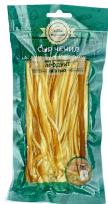
СЫР «ЧЕЧИЛ» «НИТЬ» КОПЧЕНЫЙ 100г 1/10 шт