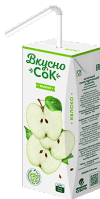
Напиток «Вкусносок» ~ Яблоко ~ 0.2 л 1/27 шт