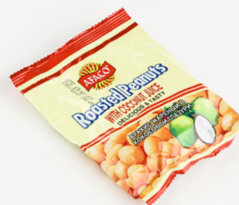
АРАХИС СЛАДКИЙ «ТАМ-ТАМ» 1/100 шт