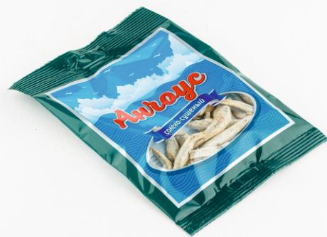
АНЧОУС СОЛЁНО-СУШЕНЫЙ 18г 1/20/180 шт