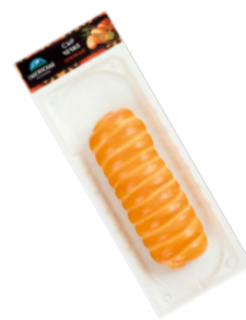
СЫР ЧЕЧИЛ КОПЧЕНЫЙ «ГИАГИНСКИЙ» 100г 1/10 шт