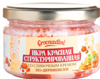
ИКРА ЛОСОСЕВАЯ КРАСНАЯ СТРУКТ-Я С КРЕМОМ ПО-ДЕРЕВЕНСКИ 180г 1/12 шт