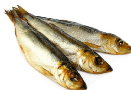
КИЛЬКА ВЕСОВАЯ КОПЧЕНАЯ кг