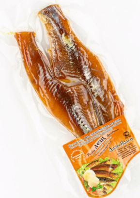
ТУШКА ЛЕЩА ЧИЩЕНАЯ