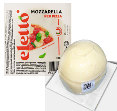
СЫР МОЦАРЕЛЛА ELETTO ШАР 200г 1/6 шт