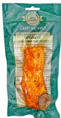
СЫР «ЧЕЧИЛ» «КОСИЧКА» С ПЕРЦЕМ 100г 1/10 шт