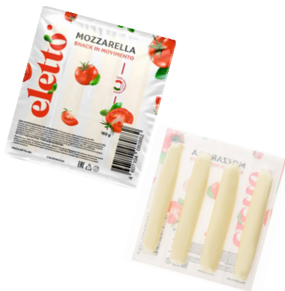
СЫР МОЦАРЕЛЛА ELETTO ПАЛОЧКИ 160г 1/6 шт