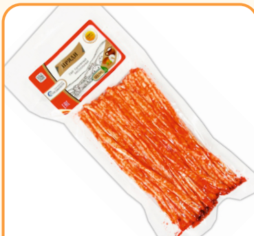
СЫР ЛАПША С ПЕРЦЕМ «ПРЯДИ» 100г 1/10 шт