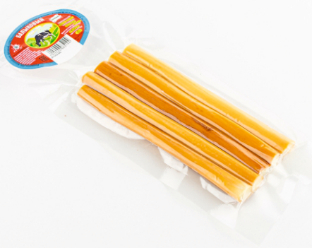
СЫР ОХОТНИЧИЙ СОЛОМКА