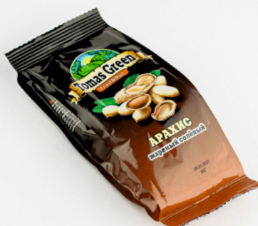
АРАХИС ЖАРЕННЫЙ СОЛЕННЫЙ 80г 1/24 шт