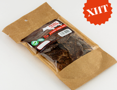
ЧИПСЫ ИЗ ГОВЯДИНЫ «КРАФТ» 40г 1/10 шт