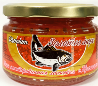
ИКРА ЛОСОСЕВАЯ КРАСНАЯ ИМИТ-Я «ПРЕМИУМ» «ЗОЛОТОЕ МОРЕ» 220г 1/12 шт