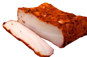
КУРДЮК КОПЧЕНЫЙ ВЕСОВОЙ кг