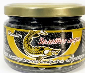
ИКРА ОСЕТРОВАЯ ЧЕРНАЯ ИМИТ-Я «ПРЕМИУМ» «ЗОЛОТОЕ МОРЕ» 220г 1/12 шт