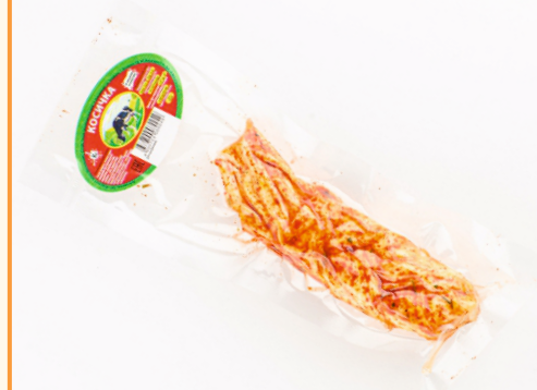
СЫР КОСА С ПРИПРАВКОЙ В ВАКУУМЕ ШТУЧНО, БЕЗ ВОЗВРАТА!