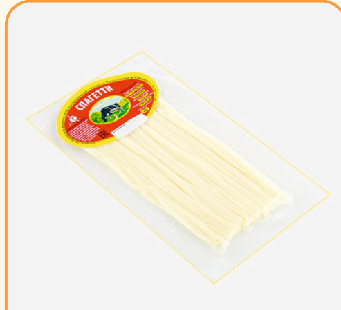
СЫР ЛАПША 20г 1/100 шт