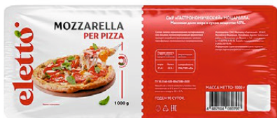
СЫР МОЦАРЕЛЛА ELETTO БРУС 1000г 1/5 шт