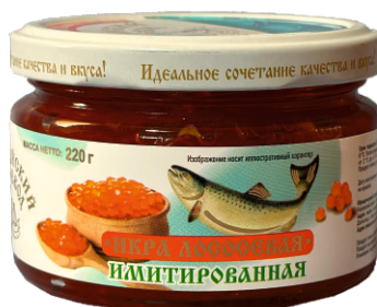
ИКРА ЛОСОСЕВАЯ КРАСНАЯ ИМИТ-Я «КАСПИЙСКИЙ НЕВОД» 220г 1/36 шт