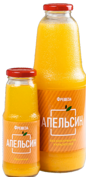
Нектар «Фрешеза» ~ Апельсин ~ 250 мл | 1000 мл