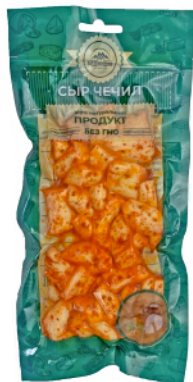
СЫР «ЧЕЧИЛ» «КУСОЧКИ» С ПЕРЦЕМ 100г 1/10 шт