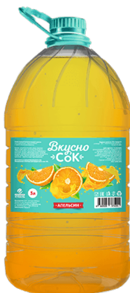
Напиток «Вкусносок» ~ Апельсин ~ ПЭТ 5 л 1/2 шт