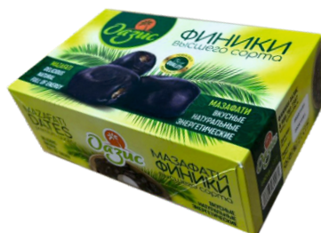
Финики «ОАЗИС» 1/12 шт