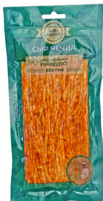
СЫР «ЧЕЧИЛ» «НИТЬ» С ПЕРЦЕМ 100г 1/10 шт