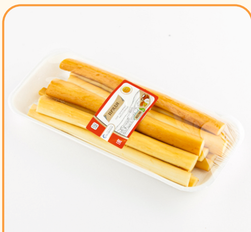
СЫР ОХОТНИЧИЙ «ПРЯДИ» В ЛОТКЕ 170г