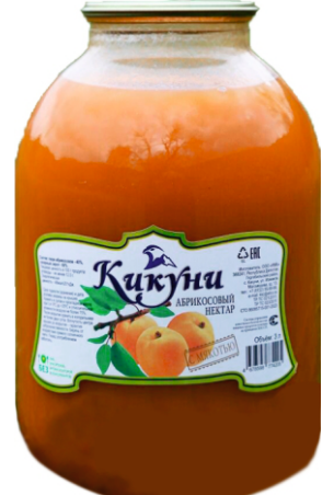
Нектар "Кикунь" Абрикосовый с мякотью 3 л | 4 шт/уп