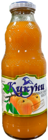
Нектар "Кикунь" Абрикосовый с мякотью 0,5 л | 12 шт/уп