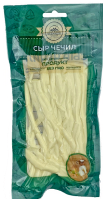
СЫР «ЧЕЧИЛ» «НИТЬ» БЕЛЫЙ 100г 1/10 шт